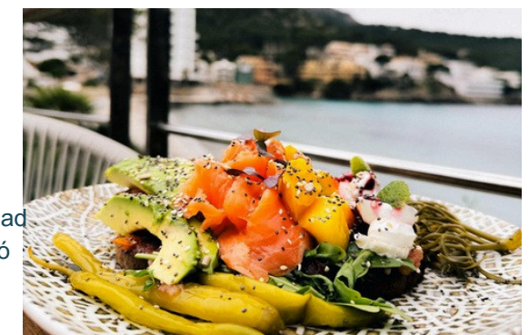
Pa amb oli de salmón marinado

Aguacate, mango, requesón y salmón marinado por nuestro chef Avocado, mango, ricotta cheese and salmon marinated by our chef Avocado, Mango, Ricotta-Käse und Lachs, mariniert von unserem Chefkoch